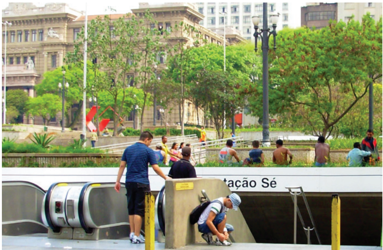
foto: Estação Sé, São Paulo

Incluiu, ainda, a elaboração e aplicação de metodologias e instrumentos denominados "diálogos regionais", também programados para ampliar a mobilização e a consulta de rede de atores não governamentais nacionais, regionais e locais, propondo ações complementares e específicas para os territórios impactados pelos projetos do PAM 2013-2040.