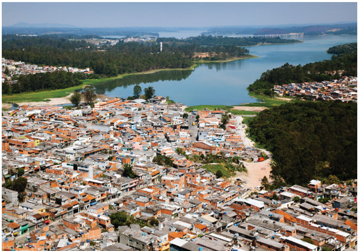
foto: Jd. Laura - Represa Billings - São Bernardo do Campo/Rodopanel (Nelson Kon)