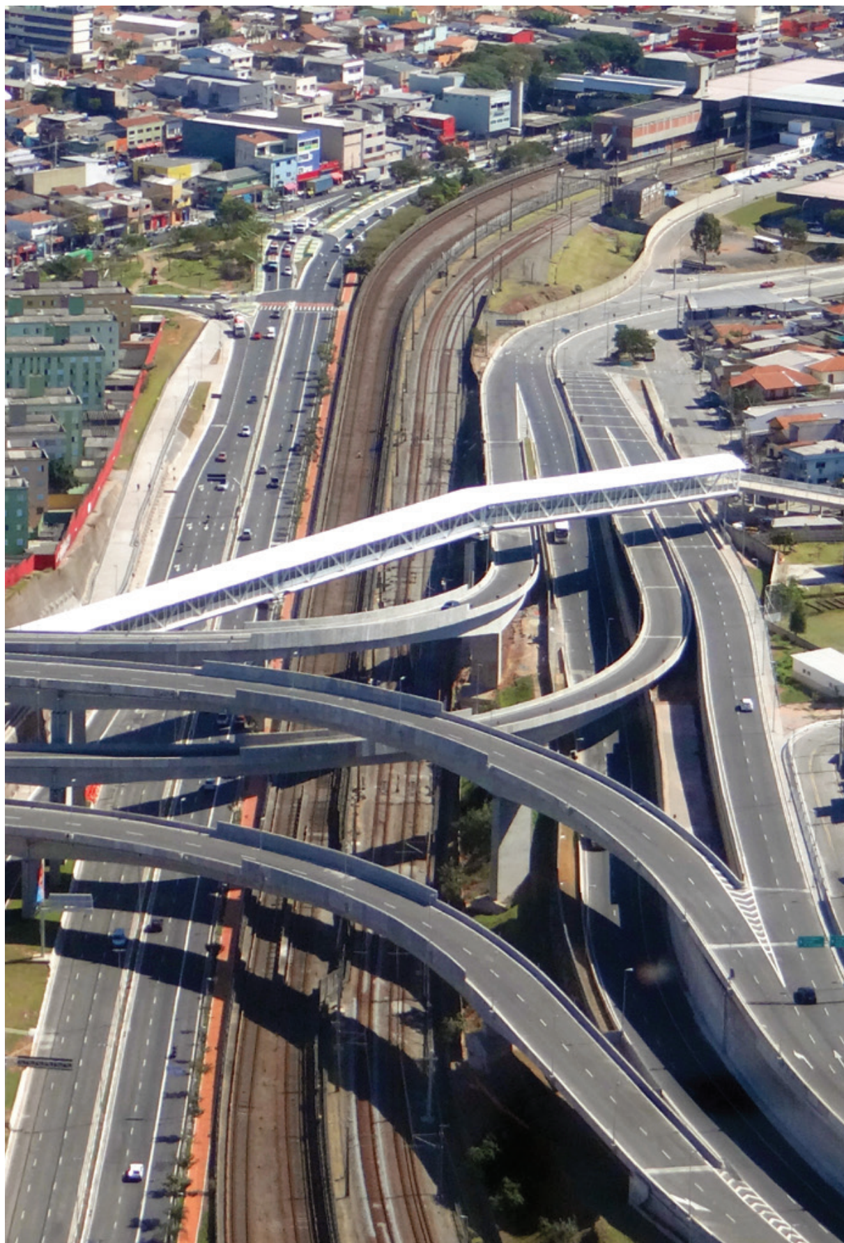
Passarela de Transposição dos Trilhos Metrô/CPTM - Itaquera